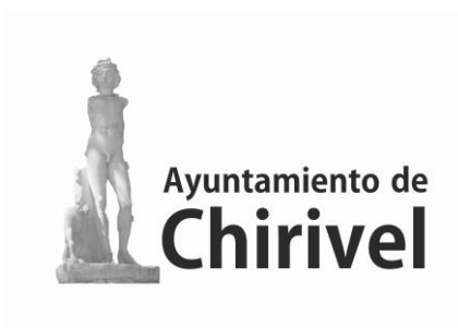
AYUNTAMIENTO DE CHIRIVEL