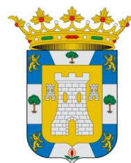
AYUNTAMIENTO DE VILLANUEVA DE LAS TORRES