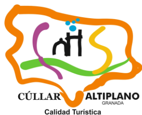
AYUNTAMIENTO DE CÚLLAR