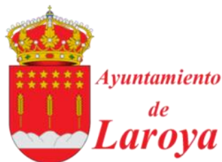
AYUNTAMIENTO DE LAROYA